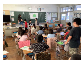
学級活動での話し合い