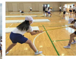
柔軟性アップ運動