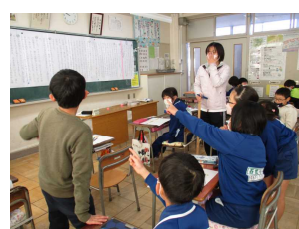
グループ学習での学び合い