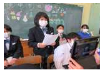
特別支援学級リモート交流会