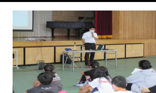
親子学び合い教室