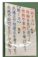
中学校の「話す力」「聞く力」