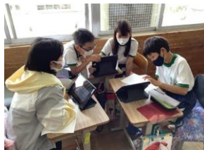
5年生「聞いて、考えを深めよう」自分たちの話し合いの様子をタブレットで確認している。(祇園小)