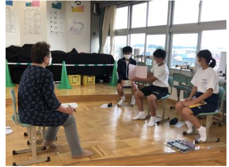
読み聞かせの事前指導の様子