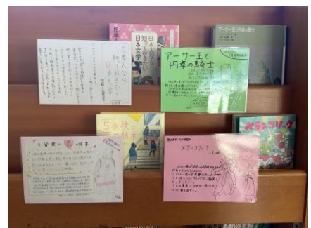
おすすめの本とポップの展示