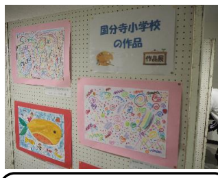
作品交流（公民館の展示）