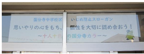
いじめ防止スローガン 昇降口に掲示