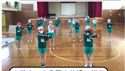
小学生による国中体操の様子