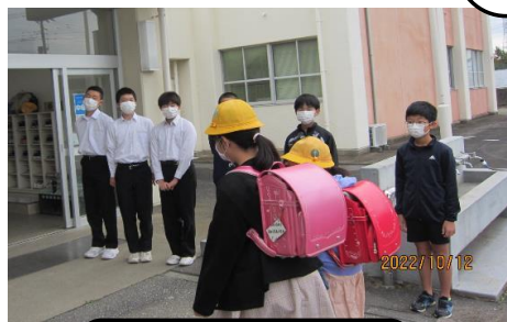
小中あいさつ運動