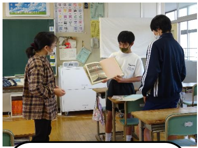
読み聞かせボランティアとの読み聞かせ練習