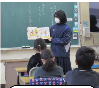
中学生による小学校での読み聞かせ