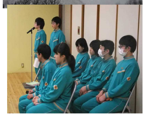
実行委員の皆さん