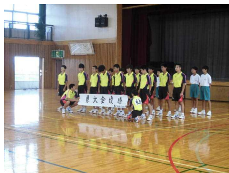
ソフトテニス部男子