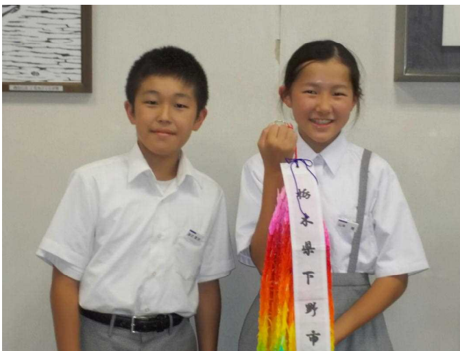
広島平和学習で奉納する千羽鶴が完成しました