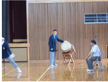
太鼓はよく見ると〇〇先生？