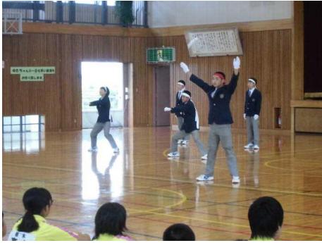
応援団によるエール