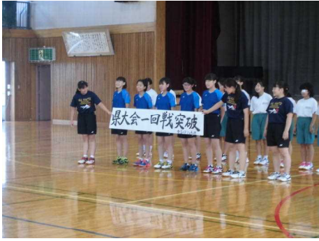
バドミントン部女子