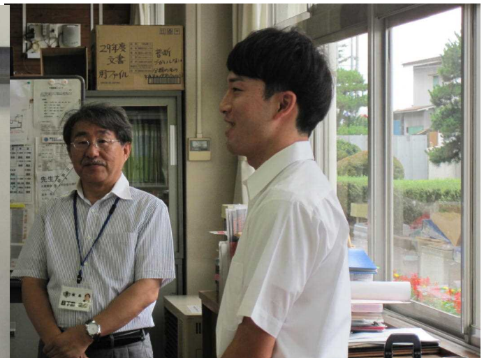
山口先生のあいさつ