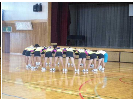
ソフトテニス部女子