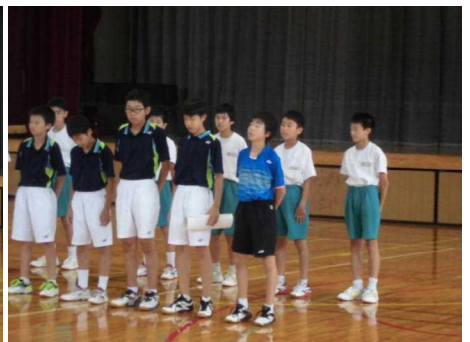
バドミントン部男子