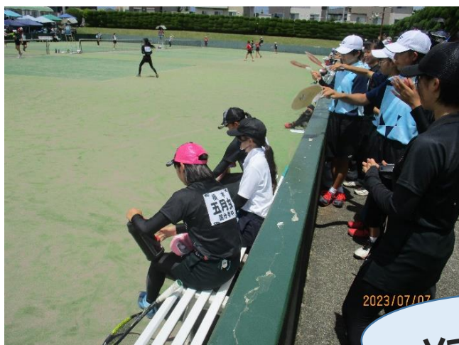
ソフトテニス女子