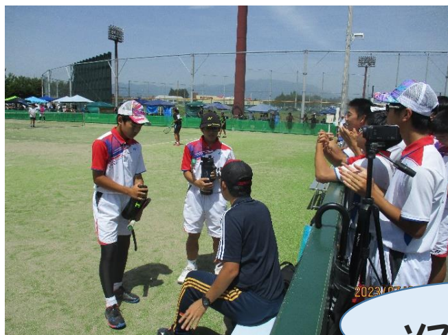
ソフトテニス男子