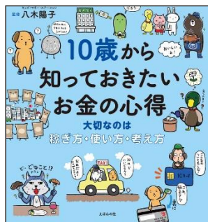
『10歳から知って おきたいお金の心得』 八木 陽子 著