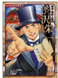
『渋沢栄一』 加来 耕三 監修