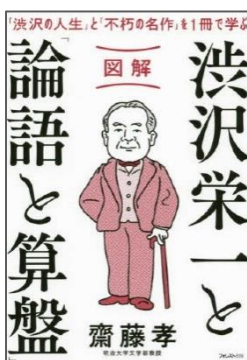
『渋沢栄一と論語と算盤』 齋藤 孝 著