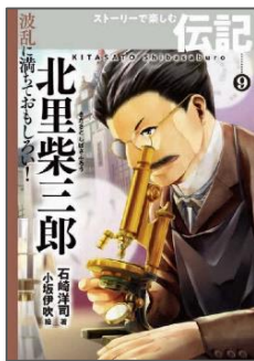
『北里柴三郎』 石崎 洋司 著