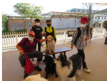
那須どうぶつ王国