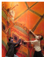
那須とりっくあーとぴあ