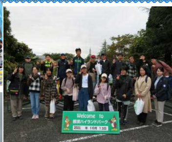
那須 ハイランドパーク