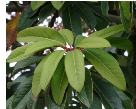
西門付 近のユ ズリハ