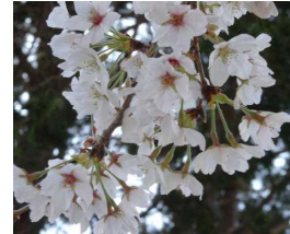
校庭の サクラ 春爛漫