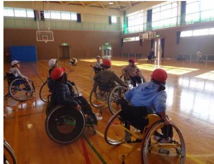
すいすい運転出来るようになって、バスケットに夢中です！