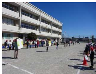
6年生からのお礼の言葉とプレゼント