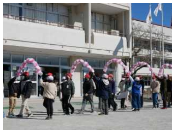
アーチをくぐって入場