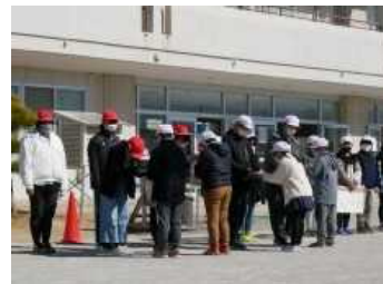
在校生からのプレゼント