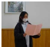
児童代表の言葉と動画視聴

「6年生を送る会」は、2部構成で、第1部は、各クラスでメッセージ動画や思い出のスライドショーを鑑賞しました。第2部は、校庭に全校児童が集まり、6年生にプレゼントやエールを贈りました。天気にも恵まれ、心のこもったエールが校庭にこだましていました。