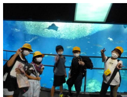
【アクアワールド水族館】