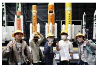
筑波宇宙センター

10月23日から25日まで、5年生が臨海自然教室に行ってきました。初日の午前中は、筑波宇宙センターを見学しました。宇宙服や宇宙船などとてもわくわくしながら見学しました。午後は、とちぎ海浜自然の家で館内オリエンテーリング、夜にはナイトハイキングをしました。2日目は早朝に海岸散歩をして、午前中は野外調理、午後は砂浜活動を行いました。3日目は、塩づくりと壺焼きいもを作りました。2泊3日という小学校生活で一番長い行事ですが、その分児童同士の連帯感や協調性が高まりました。また、早朝の海風の気持ちよさや火起こしの難しさ、塩を作る大変さなど普段体験できないことを学ぶことができました。