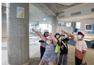
館内オリエンテーリング