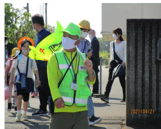
スクールガードボランティアの皆さん