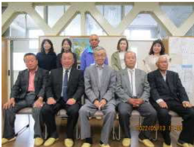
【学校運営協議会の皆様】

「学校だより」や「いしきた」でもお知らせいたしました。詳しくは、ホームページ「学校運営協議会」をご覧ください。