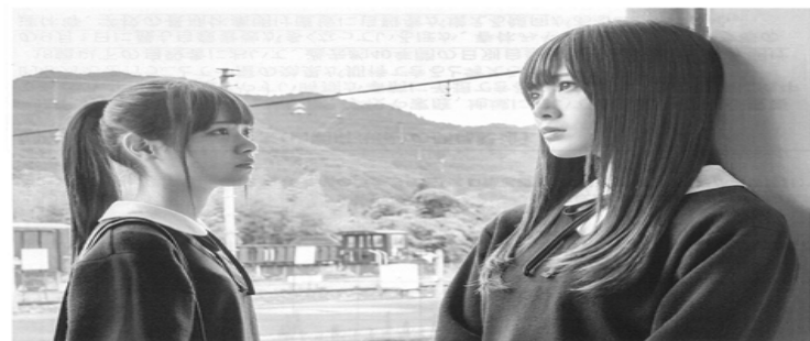
学校でのいじめに悩んだら、心配な友達がいいたら、いつでも話を聞きましょう