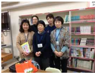
読み聞かせボランティア

本校は今年度も多くの学校支援ボランティアさんに学習の支援や見守り、環境整備の支援をしていただきました。お陰様で、今年も充実した教育活動を展開することができました。その報告も兼ねて、今年初めて2月13日(木)に学校支援ボランティア報告会を開きました。今までお世話になったボランティアさんに集まっていただき、ボランティアを活用した取組やその教育的効果を確認していただきました。今年はコロナウィルスの感染拡大防止のため「スクールガードボランティアさん感謝の会」が中止となってしまいました。