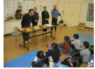
3年ふくべ細工の指導支援