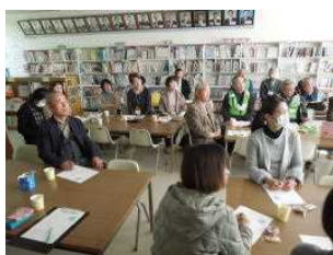
ボランティア報告会