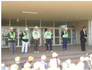
スクールガードボランティア