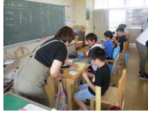
5年家庭科裁縫支援