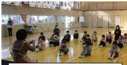
下学年へ「石橋お話会」読み聞かせ