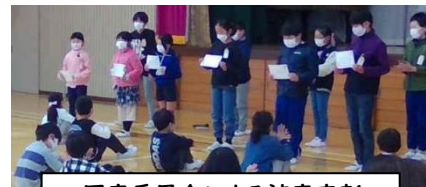
図書委員会による読書表彰