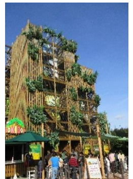
11月22日(火)全校でモビリティリゾートもてぎに行きました。縦割り班ごとにいろいろな遊びを楽しみました