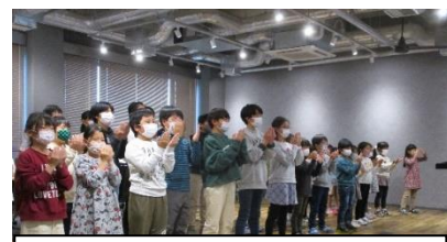
オープニングセレモニーで演奏

3日(土)は新石橋公民館のオープニングセレモニーに参加しました。石橋地区の全部の小学校がこの開催に関わり、本校は150周年記念式典で演奏した曲を、再演しました。子どもたちの演奏に大きな拍手をいただきました。参加されたお子様の送迎等、大変お世話になりました。