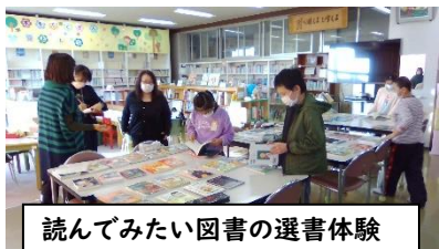
読んでみたい図書の選書体験