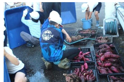
2年生と3年生が、さつまいものどろをきれいに洗って落としてくれました。本校伝統「奉仕の心」が受け継がれています。

学校教育は、生きる力の育成を目指して、「知・徳・体」の調和のとれた児童生徒を育てることを基本とします。特に、小学校教育では、未来の創り手となる子どもたちが、学習や運動、そして人との関わり等、将来必要となる資質と能力の基礎基本を身に付けることを目標としています。単なる知識注入でなく、様々な言語活動や体験活動を通して、ものの見方や考え方を広め、自分の考えや思いが深まるよう、6年間をかけて、成長の基盤を丁寧に作りあげていきます(学習指導要領より)。本校ならではの多くの教育活動は大きな意味を為していると思います。今後も有意義な活動を目指して参ります。