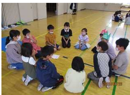
縦割り班で自己紹介