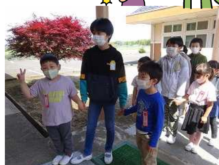
手をつないで入場です。

これから、共遊の時間（ロング昼休み）や、縦割り班清掃、いちご狩りや全校遠足などの校外活動で、一緒に活動していきます。そんな温かい環境の中で、「やさしさ」「やる気」のある、笑顔にあふれた細谷っ子になっていくでしょう。