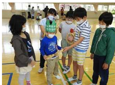
みんな応援しています。