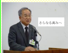
下野市教育研究所長

組織マネジメントの向上を全職員で目指し、その取組が当たり前となり、子供たちの成長につながる。そんな下野市の教育活動になっていくことを期待しています。