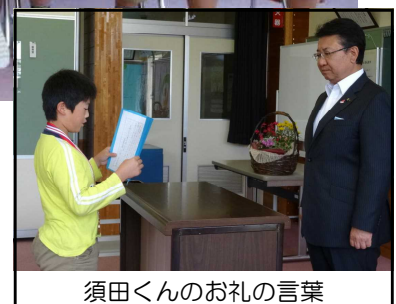
須田くんのお礼の言葉