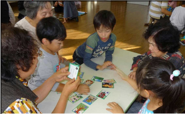
だれが一番取れるかな

9日(木)祖父母参観を行いました。1・2年生は、なかよし館でかるた取りやあやとり、校庭で竹馬や竹とんぼ飛ばしなどを祖父母と一緒に楽しく遊びました。3・4年生は体育館で、祖父母からわらのしぼり方や切り方などを教わりながらわらでっぽう作りを行いました。5・6年生は体育館東側のアトリウムで、しもつけ風土記の丘のボランティアの方々から教わりながら、祖父母と一緒にまが玉作りに挑戦しました。