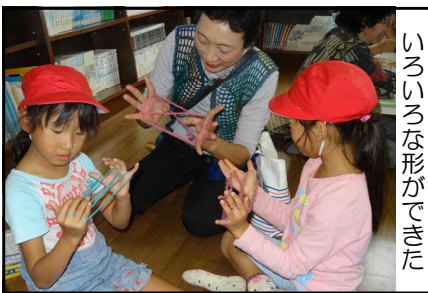
いろいろな形ができた

祖父母の方々も孫たちとふれあえることができ、楽しいひとときを過ごせたと感想を述べていました。