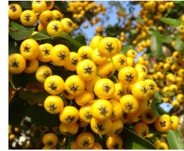
職員室南側の ピラカンの サスの実