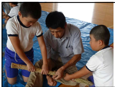
縄できつく巻きつけて