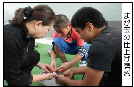
まが玉の仕上げ磨き